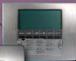
Clavier LCD à large écran.